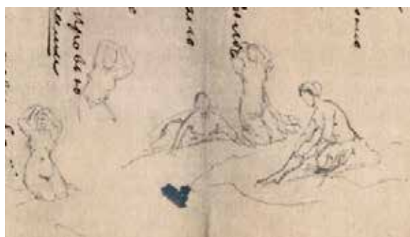
Рис. 3. Т.Г. Шевченко. Начерки на полях рукопису балади «Русалка»

Десь у березні 1859 р. Шевченко мав можливість спробувати свої сили у фресці, адже П. Кочубей доручив йому розписати стіни свого дому на березі Неви в Петербурзі. Композицію не здійснив, але зготував ескізи, з яких дійшла до нас ескізна картина «Русалки» (Див. рис. 1). Роботу виконано на папері, на звороті внизу чорнилом напис «Русалки на Дніпрі», сюжетною основою є тема «Як русалки місяць ловлять». Є три етюди до цього малюнка під назвою «Русалка» (Див. рис. 4). Центральна група згаданої картини складається з трьох русалок. Вони, як три грації, несуться кругом місяця. Дві мають розпущені коси, одна заплетена у дві коси, перевиті за українським звичаєм стрічками. Середня русалка тримає в руках накривало, що напнуло під опорою повітря. Це все відбувається в повітрі, а знизу річка Дніпро, у якій видно теж русалок. Одна русалка цілує козака, що потопав, від якого сплила шапка на воді, а інші виринають із води й плывуть до байдака. Та русалка, яка затоплює козака, плутається у водяних заростах. Далеко видно силует берега й будинків [29, с. 282]. Цей зміст картини нагадує баладу «Причинна»: «Місяченьку! / Наш голубоньку! Ходи до нас вече-